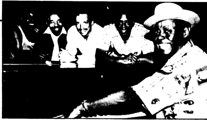
El jazz estará incluido en estos festivales

■ El Liceu fue ayer el escenario del rodaje de un anuncio de televisión protagonizado por la soprano Montserrat Caballé. El spot, de 30 segundos de duración, será emitido por Super Channel y Sky Channel y promocionará el turismo español en el extranjero. (Página 61.)