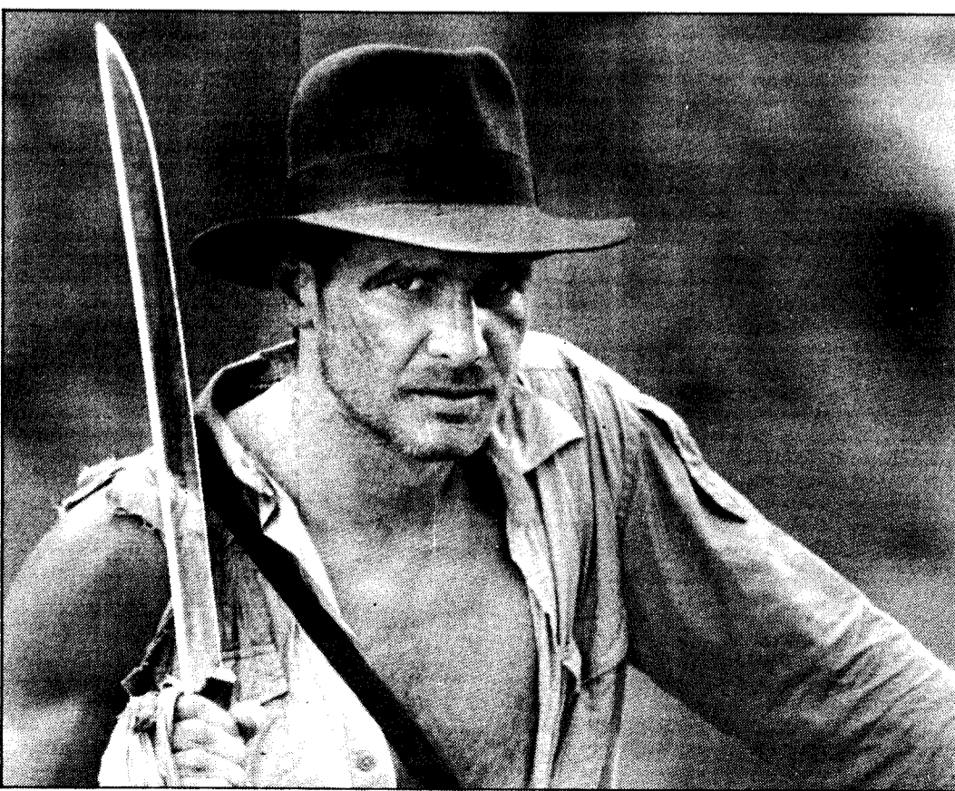
Spielberg, dicharachero y alegre, habló sobre sus planes en torno a Indiana Jones